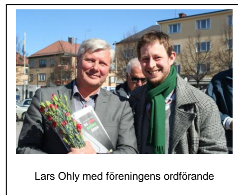
Lars Ohly med föreningens ordförande