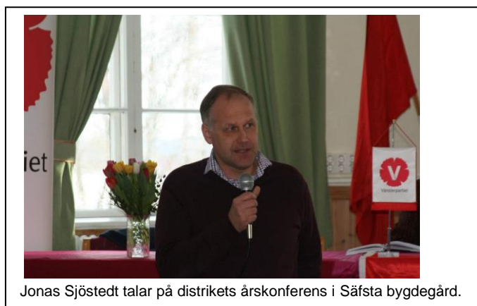
Jonas Sjöstedt talar på distriktets årskonferens i Säfsta bygdegård.