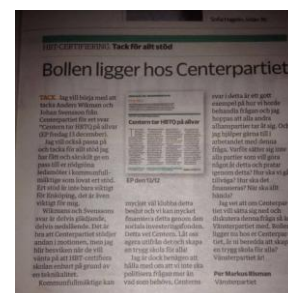
Så kan en insändare se ut. Här Per Markus om HBT-certifiering