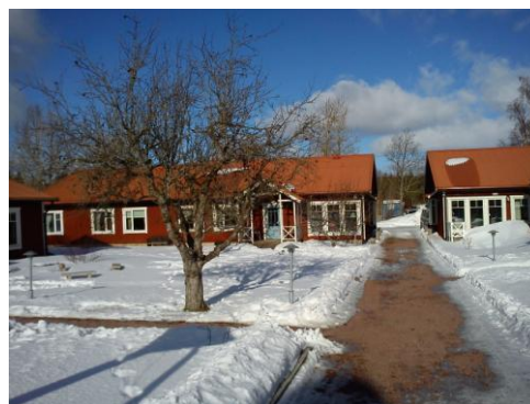
Syninge kursgård 11-06-03